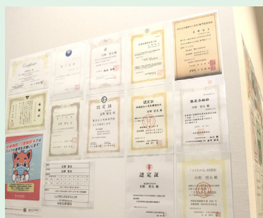
「小児専門医」・「地域総合小児医療認定医」の認定証をはじめとした認定証の数々