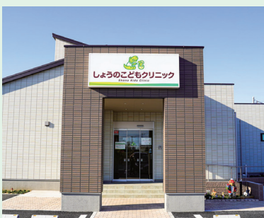
しょうのこどもクリニック・外観

「最後にかしすの読者の方々にメッセージをお願いします。」 そうですね、お子様の健康や病気で困ったときに「まずは来てください」でしょうか(笑)。はじめは相談するということお気持ちでいいので、お子様のことで悩んでいることがあれば抱え込まず受診してください。」